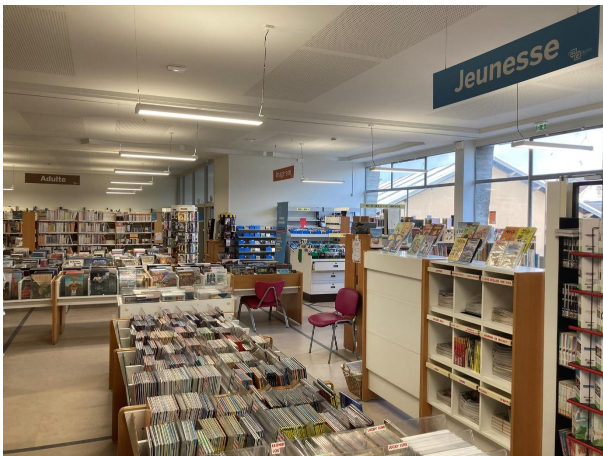
Figure 2. Médiathèque provisoire à l'Espace Culturel Bellevue.

Au total, les collections atteignent 100 000 documents, dont 45 000 pièces du fonds patrimonial appartenant à l'État ou à la collectivité. L'inscription à la Médiathèque du Grand Verdun est gratuite pour tou.te.s. Le prêt est de 15 documents pour une période de 4 semaines, dont 6 livres, 3 CD, 3 DVD et 3 périodiques. Pour les nouveautés, les périodiques ne sont pas empruntables et les livres le sont pour une durée de 2 semaines uniquement, afin d'assurer un meilleur roulement par rapport à la demande. Une prolongation peut être accordée (4 semaines, 2 pour les nouveautés). Les enseignant.e.s peuvent bénéficier d'une durée de prêt de deux mois et d'un nombre de documents illimités pour leur usage professionnel (compte lecteur.rice professionnel séparé du compte lecteur.rice classique).